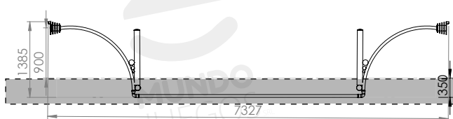
Producto preparado para empotrar 350 mm