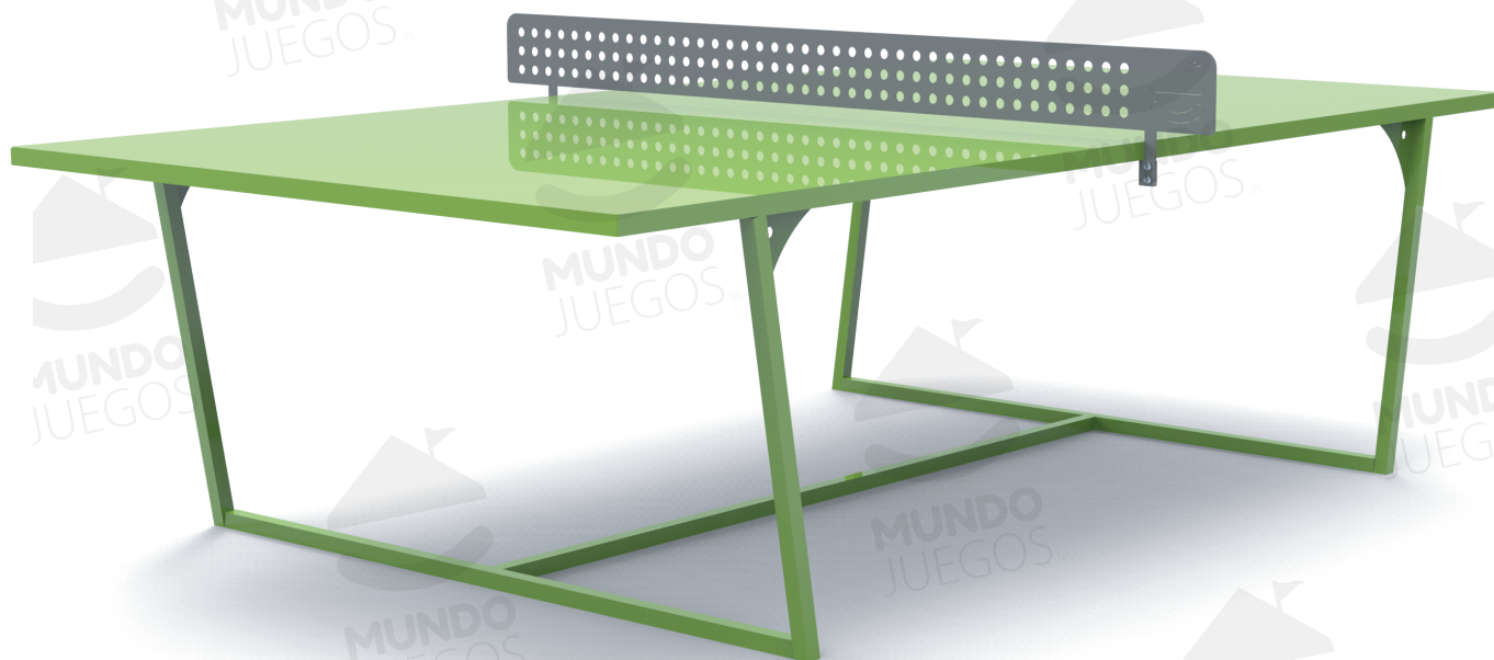
Imagen referencial. Para más información ingrese a www.mundojuegos.com.ar